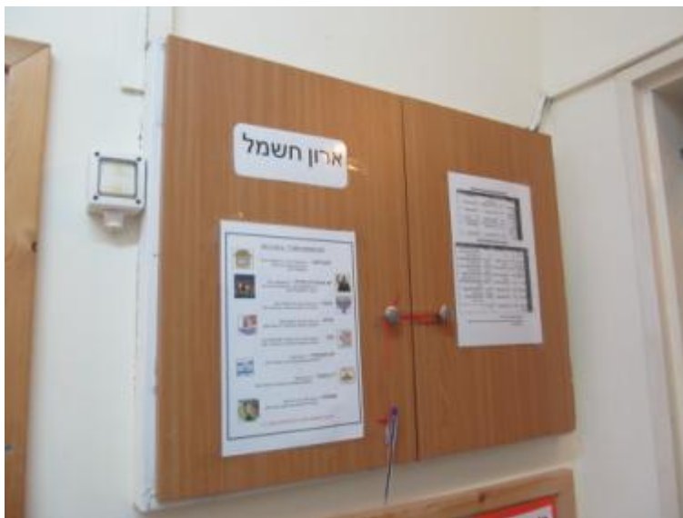
תמונה 2 : אולם הגן – רחבת היצירה